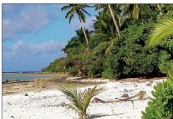
Prolonger l'été au mois de novembre...

Une vingtaine de rendez-vous du 2 au 27 novembre « Une quarantaine de partenaires de toute la Nièvre