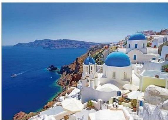
Trente rendez-vous culturels pour partir à la découverte du trait d'union Grèce-Turquie.

« Qui a envie de voyager avec nous ? » Invitant à « prendre une petite dose de soleil » avant d'hiverner, la question a appelé des réponses au-delà de