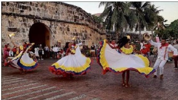
Faire voyager depuis son canapé, le leitmotiv de Grands Chemins.

► Ne pas se laisser abattre et repartir au combat. Encore et toujours. C'est la philosophie de la Cité du mot et de leurs partenaires, qui après avoir dû adapter l'organisation du festival Aux Quatre Coins du Mot lors du premier confinement, a de nouveau fait le choix de proposer des divertissements culturels sur le mois de novembre, dans le cadre du festival Grands Chemins. « On veut être force de proposition. Novembre sera placé sous le signe du voyage, de la curiosité, du partage et de la solidarité, les principes fédérateurs de Grands Chemins et on va en avoir encore plus besoin dans les semaines à