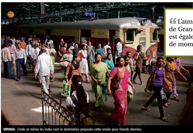
VOYAGE. L'Inde et même les Indes sont la destination proposée cette année pour Grands chemins.

■ Quel est l'esprit de Grands chemins ? Il s'agit de la 4 e édition. L'an passé, la crise sanitaire nous avait empêchés d'être présents en réel, mais nous avions tout de même mené une édition tronquée, en ligne, intitulée "vrai". L'état d'esprit est le même : Grands chemins