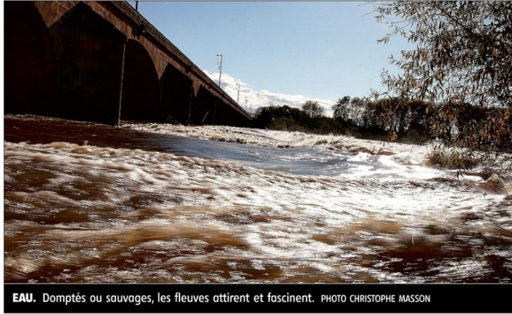
EAU. Domptés ou sauvages, les fleuves attirent et fascinent.

Domptés ou sauvages Nourriciers ou destructeurs, domptés ou sauvages, barrières infranchissables ou voies de communication indispensables, du Mississippi, au Danube, de l'Orénoque au Congo, du Mékong à l'Amour, en passant par la Loire évidemment,