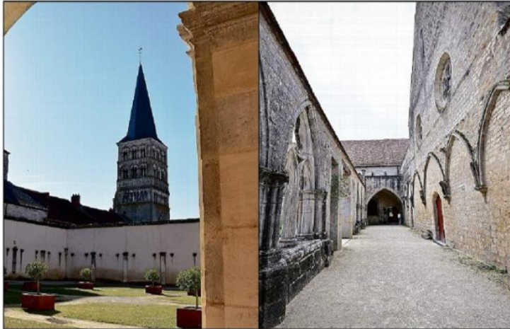
La Cité du Mot, puis l'Abbaye de Noirlac accueilleront ces rencontres.

L'un des objectifs de ces rencontres annuelles est de « mettre en lumière ce que sont les centres culturels de rencontre ». Des lieux, au nombre de 22 en France (*), qui allient patrimoine et programmation culturelle. C'est cette rencontre des deux grands pôles du Ministère de la Culture qu'ils portent dans leur nom. « Il